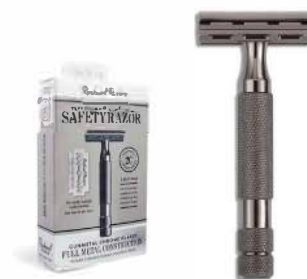
2C БРИТВА ТЕМНЫЙ ХРОМ