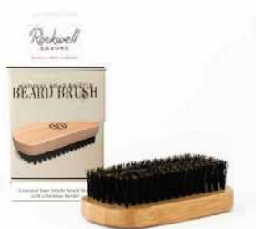
ЩЕТКА ДЛЯ БОРОДЫ БАМБУК, НАТУРАЛЬНАЯ ЩЕТИНА КАБАНА