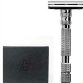
MODEL T БРИТВА ТЕМНЫЙ ХРОМ