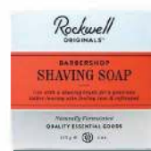
ТВЕРДОЕ МЫЛО ДЛЯ БРИТЬЯ 113 g