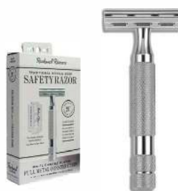
2C БРИТВА БЕЛЫЙ ХРОМ