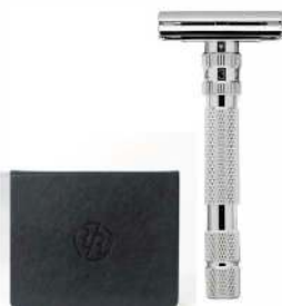
MODEL T БРИТВА БЕЛЫЙ ХРОМ