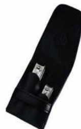
НАБОР КУСАЧЕК ДЛЯ НОГТЕЙ НЕРЖАВЕЮЩАЯ СТАЛЬ, 2 ПРЕДМЕТА, ЧЕХОЛ