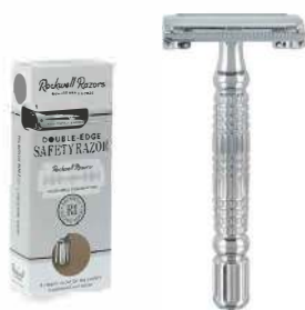
R1 БРИТВА БЕЛЫЙ ХРОМ