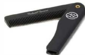
МУЖСКАЯ СКЛАДНАЯ РАСЧЕСКА ДЛЯ ВОЛОС