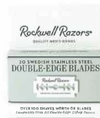
ДВУСТОРОННИЕ ЛЕЗВИЯ 20 ШТУК В УПАКОВКЕ