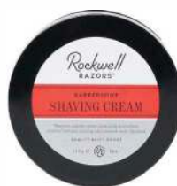
КРЕМ ДЛЯ БРИТЬЯ 113 g