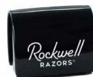
НАКОПИТЕЛЬ ДЛЯ ИСПОЛЬЗОВАННЫХ ЛЕЗВИЙ