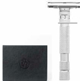
MODEL T БРИТВА БЕЛАЯ