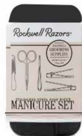
МАНИКЮРНЫЙ НАБОР 5 ПРЕДМЕТОВ, ЧЕХОЛ