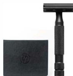
6S БРИТВА ЧЕРНАЯ НЕРЖАВЕЮЩАЯ СТАЛЬ