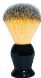
ПОМАЗОК СИНТЕТИЧЕСКИЙ ВОРС, ЧЕРНЫЙ АКРИЛ