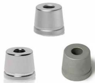
ПОСТАВКА ДЛЯ Т- ОБРАЗНОЙ БРИТВЫ БЕЛЫЙ ХРОМ, ТЕМНЫЙ ХРОМ, МАТОВАЯ