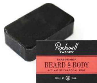
МЫЛО ДЛЯ БОРОДЫ И ТЕЛА АКТИВИРОВАННЫЙ УГОЛЬ 170 g