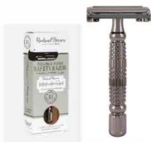
R1 БРИТВА ТЕМНЫЙ ХРОМ