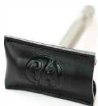
ЧЕХОЛ ДЛЯ ЛЕЗВИЙ ЧЕРНАЯ КОЖА