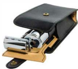
ДОРОЖНЫЙ НАБОР 2 ПРЕДМЕТА 2С БРИТВА, ПОМАЗОК ИЗ СИНТЕТИЧЕСКОГО ВОРСА, ЧЕХОЛ