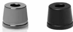
ПОДСТАВКА ДЛЯ Т- ОБРАЗНОЙ БРИТВЫ ТЕМНЫЙ ХРОМ И МАТОВАЯ ЧЕРНАЯ