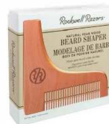
ТРАФАРЕТ ДЛЯ БОРОДЫ С ГРЕБНЕМ ГРУШЕВОЕ ДЕРЕВО