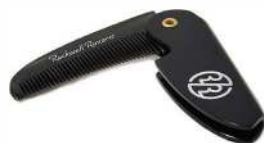
КАРМАННАЯ РАСЧЕСКА ДЛЯ БОРОДЫ И УСОВ АКРИЛ