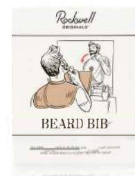
ФАРТУК ДЛЯ СТРИЖКИ БОРОДЫ