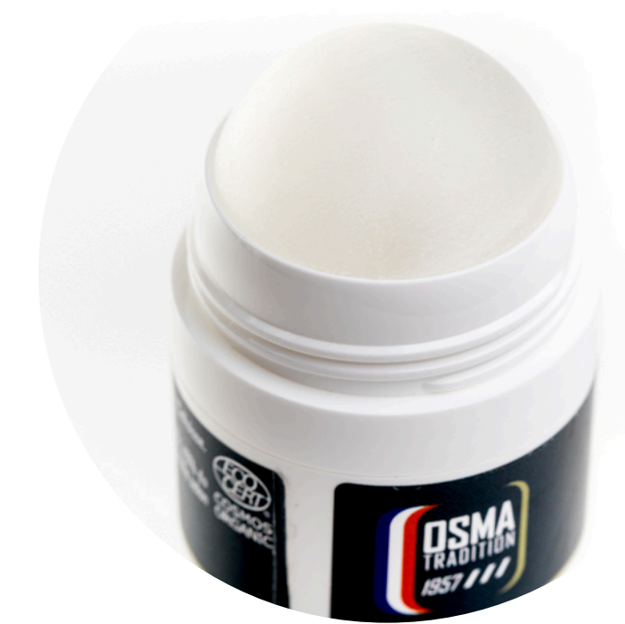
OT-ROLLALOE Шариковый дезодорант OSMA TRADITION, алое вера, 50 мл