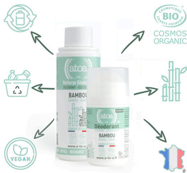
Шариковый дезодорант АТОО, бамбук, 100 мл., рефилл АТОО-REROLL-BAMBOU