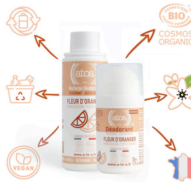
Шариковый дезодорант АТОО, флёрдоранж, 100 мл., рефилл АТОО-REROLL-ORANGER