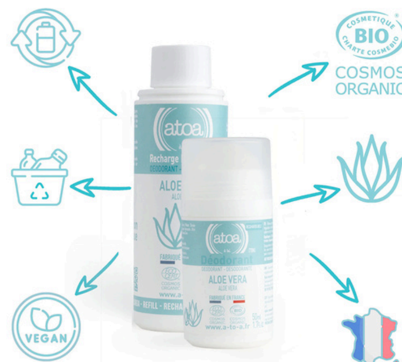
Шариковый дезодорант АТОО, алоэ вера, 100 мл., рефилл АТОО-REROLL-ALOE