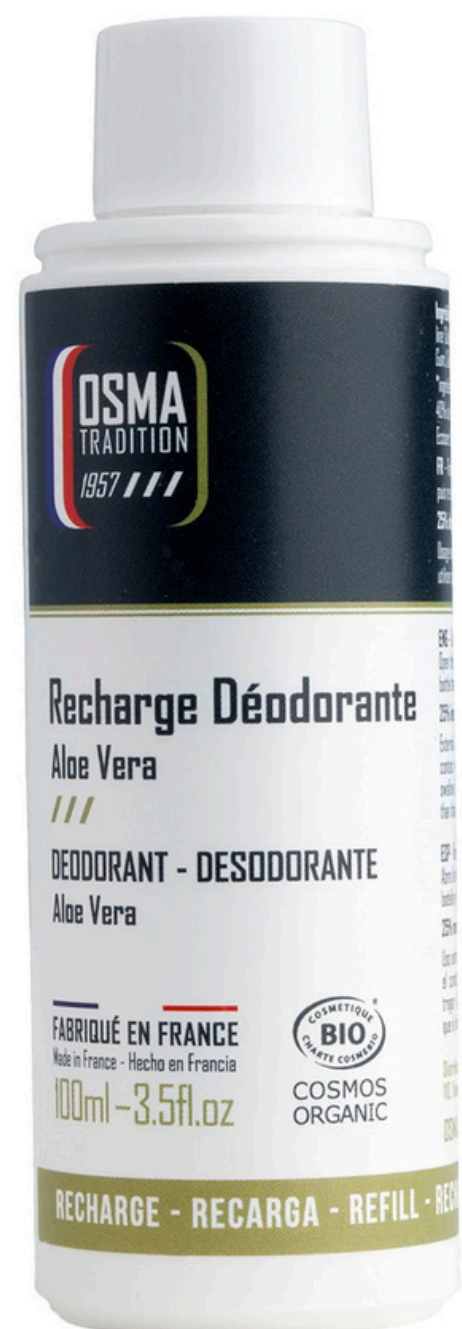
Шариковый дезодорант OSMA TRADITION, алое вера, 100 мл., рефилл OT-REROLLALOE