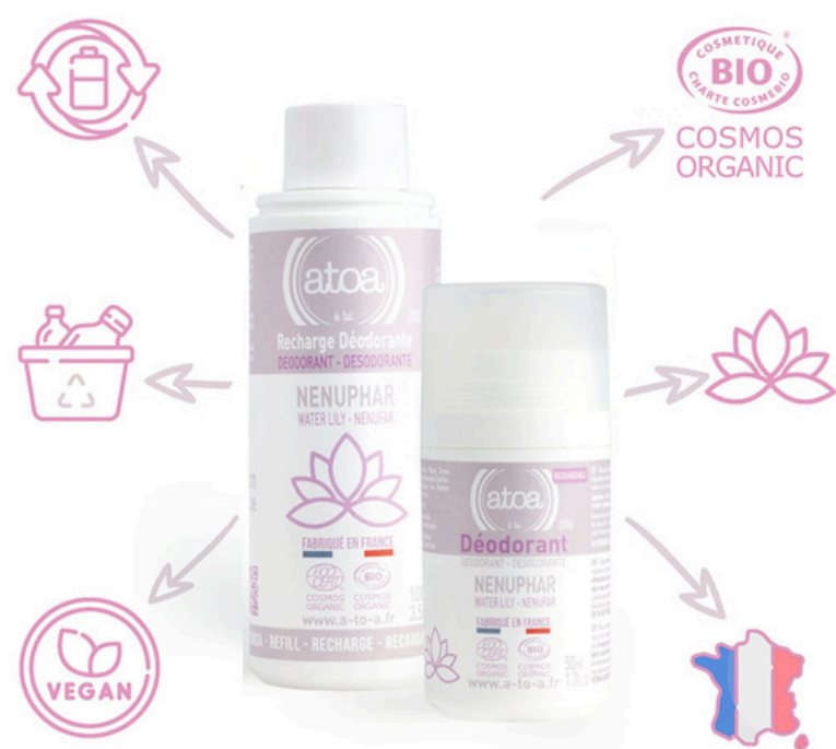
Шариковый дезодорант АТОО, водяная лилия, 100 мл., рефилл АТОО-REROLL-NENUPHAR